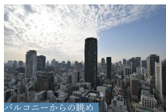
バルコニーからの眺め

【物件番号】C27261709【物件概要】●所在地/大阪市中央区北浜東 ●交通/Osaka Metro堺筋線「北浜」駅徒歩5分●専有面積/58.65㎡ ●バルコニー面積/10.17㎡ ●アルコーブ面積/222㎡ ●構造・階数/鉄筋コンクリート造地上41階地下1階建の34階部分 ●築年月/2014年6月 ●管理形態/全部委託 ●管理員の勤務形態/日勤 ●管理費/月額14,100円 ●修繕積立金/月額15,250円 ●引渡可能年月/相談 ●現況/空室【取引態様】媒介(仲介)