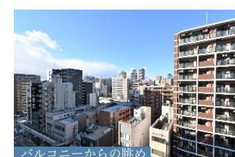
バルコニーからの眺め

【物件番号】C2725Z213【物件概要】●所在地/大阪市中央区松屋町 ●交通/Osaka Metro長堀鶴見緑地線「松屋町」駅徒歩2分 ●専有面積/75.05㎡ ●バルコニー面積/13.19㎡ ●構造・階数/鉄筋コンクリート造地上20階地下1階建の10階部分 ●築年月/2015年6月 ●管理形態/全部委託 ●管理員の勤務形態/日勤 ●管理費/月額13,510円 ●修繕積立金/月額10,140円 ●その他費用/月額150円 (内訳：自治会費) ●引渡可能年月/相談 ●現況/居住中 ●備考/専有面積にトランクルーム面積0.48㎡を含む【取引態様】媒介(仲介)