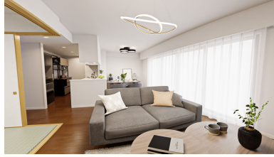
～CGリフォームイメージ～